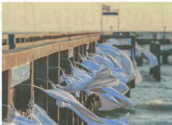
Seebrücke im Ostseebad Boltenhagen in weiß.